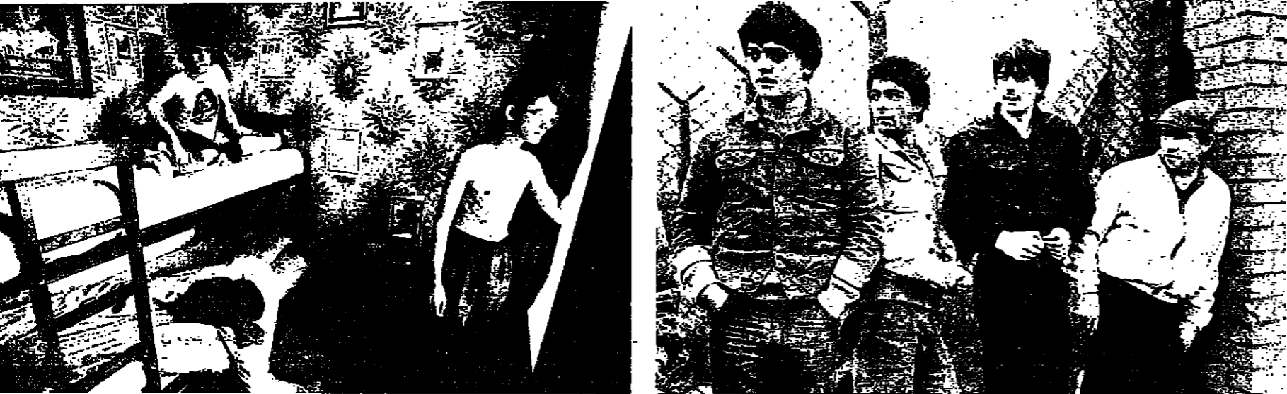
عاطلون عن العمل في أول العمر - خيرة العنق تحت الرماد